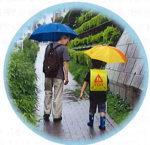
【Bさんの活動の様子】

最初は、どういう方かわからず不安があり、子どもが迷惑をかけないかななどの心配もありました。ご紹介いただいた方は、とても優しく、朝の準備に時間がかかってもゆっくり待っていてくれ、回を重ねるたびに温かさを感じています。 仲良く登校している姿をみて親戚と間違えられることがあるほど子どもも慣れてきて、前の日からとても楽しみにしています。 私自身が体調を崩していたこともあり、ガイドボランティアの方に関わってもらってから、子どもはもちろんのこと、とても良い方向に変わってきています。