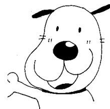
旭区社協キャラクター

こちらでは、旭区社会福祉協議会の会員の施設の活動を 紹介しています。 ボランティア情報一覧に掲載希望の施設の方は、 区社協会員になりませんか！