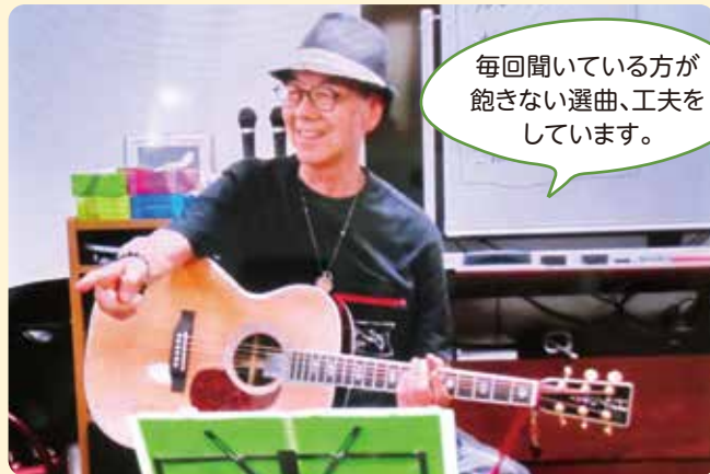
毎回聞いている方が飽きない選曲、工夫をしています。

旭区ボランティアセンターでは、ボランティア活動の推進を通して、地域の支えあいやつながりづくりを目指しています。地域の課題に対し、ボランティアの皆様のお力を借りるとともに、「一人ひとりが活躍できる」、「心地よい居場所となる」…そんなコーディネートを目指しています。今回は、活動中のお二人とジュニアボランティアの活動をご紹介します。活動に少しでも興味・関心のある方はお気軽にご相談ください。