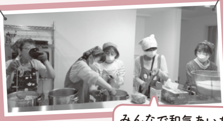
みんなで和気あいあいと 作っています!