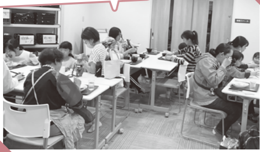
作る人も、食べに来た人も みんな一緒に食事をします。

Minnadeは「地域でつながる場を作りたい」という思いから、令和5年1月に活動を開始しました。使用する食材の多くはフードバンクかながわからの提供や、旭センターに届いた寄付でまかなわれています。子どもから大人まで、幅広い世代が集える場を目指しています。