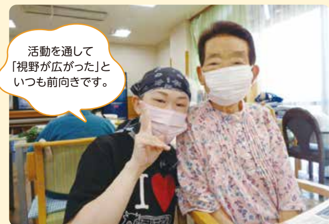
活動を通して「視野が広がった」といつも前向きです。

もともとずっと家にいたのですが、「人の為に何かしたい」という目的を持ったら、前向きに外に出ることができました。初めは、とても緊張して何をしたいかわかりませんでしたが、今では「職員になったら?」と言われるくらい慣れて、楽しくてしょうがないです。ボランティア活動は自分の中で「癒し」です!