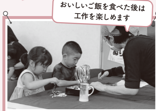
おいしいご飯を食べた後は 工作を楽しめます

8月のメニューは夏野菜カレーと、前日に準備の様子を見学する「バックヤードツアー」に参加した子どもたちと一緒に作った看板メニューの特製アップルパイでした。また、食後に誰でも楽しめる「工作コーナー」では交流や創作の時間として工夫を凝らした活動がされていました。