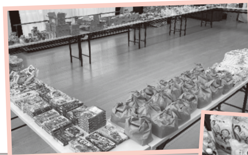
くらし応援会に寄せられた寄付物品

できることをしたい」、「お互い様で助け合いたい」、「お世話になった恩返しをしたい」と想いがたくさん込められていました。協力を呼びかけた笹野台地区社協でも「こうやって持ち寄ってくれる皆さんの気持ちが嬉しい。応援会当日のお手伝い以外にも寄付という形で様々な人に関わってもらい、住民同士の助け合いやつながりづくりをさらに深めたい」と話します。