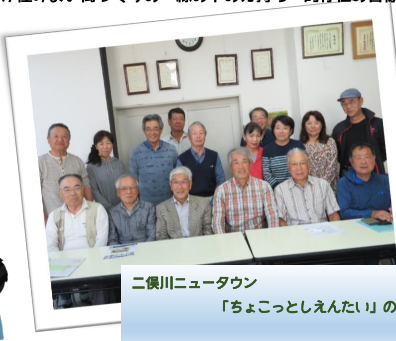
二俣川ニュータウン