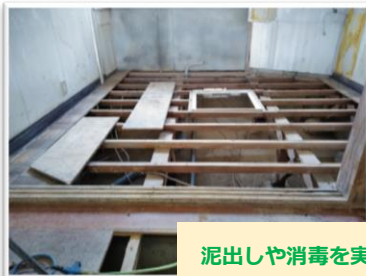
泥出しや消毒を実際に行った家

大きな災害が起きると区社協が災害ボランティアセンターを設置・運営します。被災地でボランティア活動をする際は、必ず、事前に地元の社協でボランティア保険に加入してください。