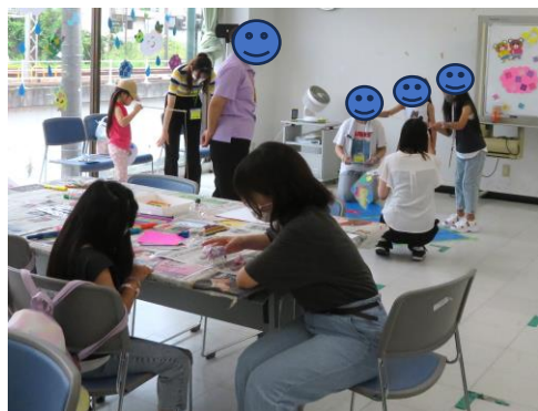
過去の子どもお楽しみコーナーの様子

※駐車場はありません。公共交通機関をご利用いただくか、 近隣の有料駐車場をご利用ください。