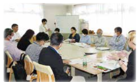
まちぐるみ福祉推進会議の様子

災害時支援の取組を検討するなかで、日常の見守りの大切さに改めて気づき、地域全体に見守りを広げるための取組を進めています。