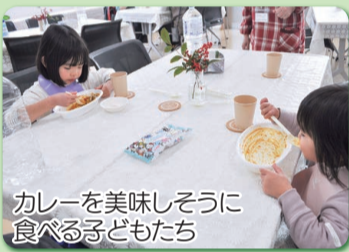
カレーを美味しくに 食べる子どもたち