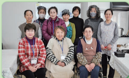
食堂を運営する方々