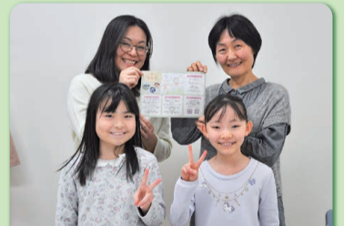
笑顔溢れる居場所に